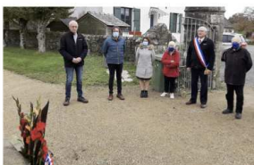
La cérémonie de commémoration de l'armistice de la Grande Guerre s'est déroulée au monument aux morts de Trémaouézan le 11 novembre dernier.